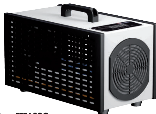
Codice: TZTA20G Descrizione: OZONE MACHINE 20G/H EAN: 8028153110584