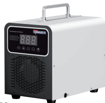
Codice: TZTA10G Descrizione: OZONE MACHINE 10G/H EAN: 8028153110577