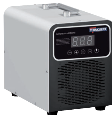
Codice: TZTA5G Descrizione: OZONE MACHINE 5G/H EAN: 8028153110560